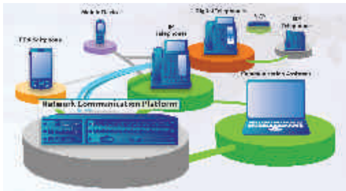
Vernetzung der verschiedenen Medien

Panasonic setzt bei seinen Lösungen zum Vorteil der jeweiligen Benutzer sowohl auf bewährte, als auch auf innovative Technologien. Im Zentrum sollen dabei nicht die Technologie sondern Ihre Mitarbeiter und die Effizienz am Arbeitsplatz stehen.