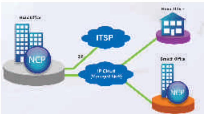
Netzwerk mit verschiedenen Standorten

Je nach Grösse und Bedürfnisse einzelner Niederlassungen, werden diese direkt in das System des Hauptsitzes integriert. Bei grösseren Filialen wird ein autonomes System installiert, das zentral vernetzt wird, um gemeinsame Ressourcen und Infrastrukturen sowie die Administration zu nutzen.