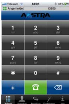
AMC für iPhone