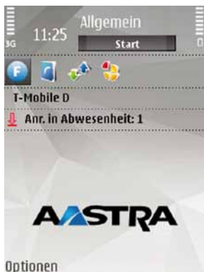
AMC für Nokia