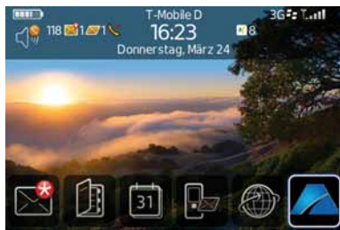
AMC für Blackberry